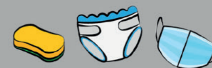
Essuie-mains, articles d'hygiène et de nettoyage