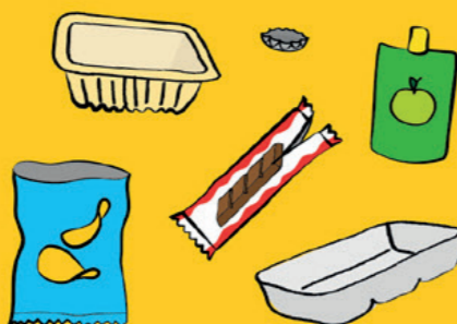
Tous les autres emballages en plastique et métal

Emballages bien vidés, en vrac, non emboîtés - pas de verre