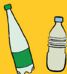
Bouteilles en plastique