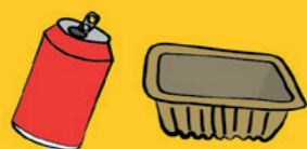
Boîtes et barquettes métalliques, aérosols, canettes