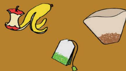
Restes de nourriture, déchets alimentaires...