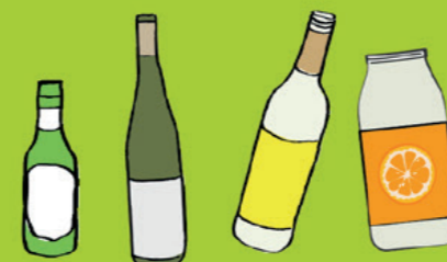
Bouteilles en verre