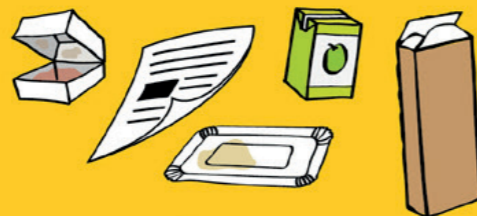
Papiers, flyers, cartons, briques alimentaires