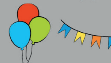
Décorations (ballons, fanions)