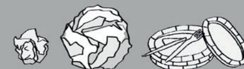
Serviettes, nappes, couverts jetables