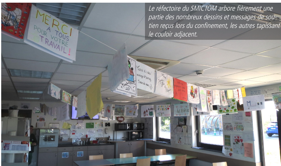
Le réfectoire du SMICTOM arbore fièrement une partie des nombreux dessins et messages de soutien reçus lors du confinement, les autres tapissant le couloir adjacent.

Gants, mouchoirs, lingettes et masques ont ainsi été retrouvés en nombre dans le bac jaune mettant directement en jeu la santé des agents de collecte et de tri. Mais l'on découvre également des encombrants, des bâches, du polystyrène, des gravats, des animaux morts... qui enrayent gravement la mécanique du centre de tri. Mais au-delà de l'aspect technique, la présence d'objets autres que des emballages ou du papier est susceptible de mettre en danger la sécurité des femmes et des hommes qui finalisent votre geste de tri.