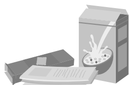
Papiers et cartons