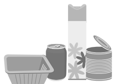
Boîtes métalliques, aérosols, canettes, barquettes en aluminium